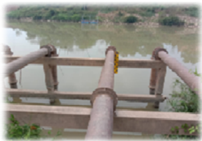
จุดสูบน้ำดิบแรงต่ำแม่ข่าย (แม่น้ำยม)