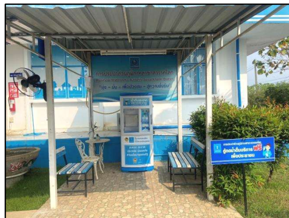
ตู้น้ำดื่มบริการประชาชน