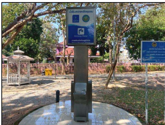
แท่นน้ำประปาดื่มได้