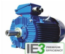
มอเตอร์ประสิทธิภาพสูง

กปภ. ได้มีการนำมอเตอร์ประสิทธิภาพสูงมาใช้งานร่วมกับเครื่องสูบน้ำในสถานีผลิต-จ่ายน้ำของ กปภ. ที่มีการเดินเครื่องเป็นเวลานาน ทำให้เห็นผลการประหยัดพลังงานไฟฟ้าได้ชัดเจน และจะประหยัดพลังงานมากขึ้นเมื่อใช้งานร่วมกับ VSD