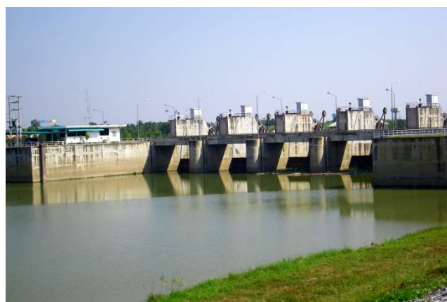
น้ำหาดสะพานจันทร์ มีความจุน้ำอยู่ที่ 15.30 ล้าน ลบ.ม.