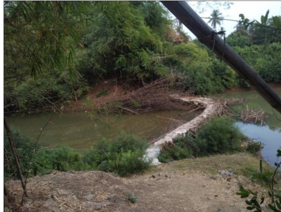
แม่น้ำป่าสัก