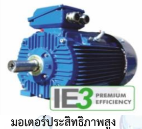
มอเตอร์ประสิทธิภาพสูง

กปภ.หนองไผ่ ได้มีการนำมอเตอร์ประสิทธิภาพสูงมาใช้งานร่วมกับเครื่องสูบน้ำในสถานีผลิต-จ่ายน้ำของ กปภ.หนองไผ่ที่มีการเดินเครื่องเป็นเวลานาน ทำให้เห็นผลการประหยัดพลังงานไฟฟ้าได้ชัดเจน และจะประหยัดพลังงานมากขึ้นเมื่อใช้งานร่วมกับ VSD