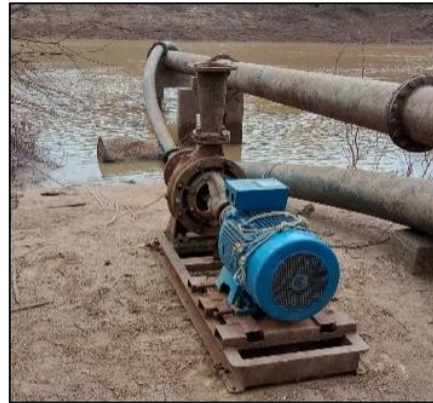
แม่น้ำป่าสัก สูบน้ำจากแรงต่ำบึงสามพัน