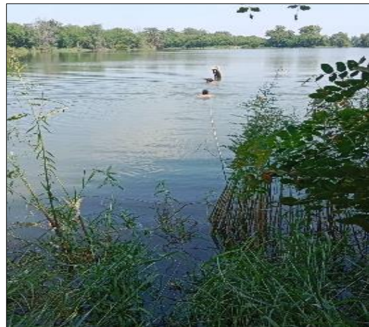
สระเก็บน้ำบึงสามพัน