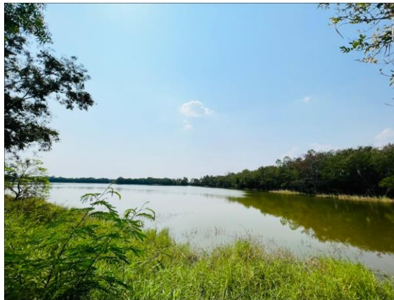
สระเก็บน้ำท่าแดง