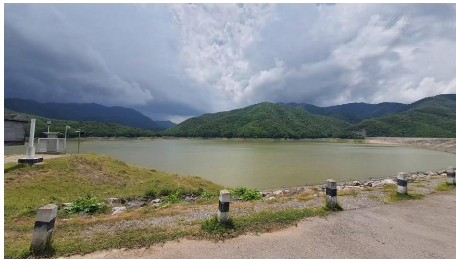
อ่างเก็บน้ำห้วยขอนแก่น