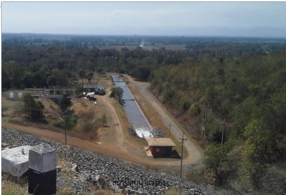
สถานีสูบน้ำแรงต่ำ

กปภ.สาขาหล่มสัก ได้นำระบบกราวิตีมาใช้ในการส่งน้ำดิบจากสถานีสูบน้ำแรงต่ำมายังสถานีผลิตน้ำแรงสูง เพื่อลดการใช้ไฟฟ้าและลดค่าใช้จ่ายด้านพลังงาน โดยใช้งานร่วมกับเครื่องสูบน้ำในสถานีสูบน้ำแรงต่ำ การส่งน้ำด้วยวิธีนี้เป็นเวลานาน ทำให้เห็นผลการประหยัดพลังงานไฟฟ้าได้อย่างชัดเจน