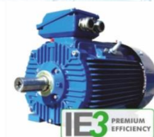
มอเตอร์ประสิทธิภาพสูง

กปภ. ได้มีการนำมอเตอร์ประสิทธิภาพสูงมาใช้งานร่วมกับเครื่องสูบน้ำในสถานีผลิต-จ่ายน้ำของ กปภ. ที่มีการเดินเครื่องเป็นเวลานาน ทำให้เห็นผลการประหยัดพลังงานไฟฟ้าได้ชัดเจน และจะประหยัดพลังงานมากขึ้นเมื่อใช้งานร่วมกับ VSD